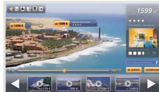
URLAUBSORTE AM FERNSEHER mit dem Heli überfliegen: Aktuelle Hotelangebote und Preise werden live eingeblendet.

■ Ende 2010 hatten laut Schätzungen rund 4 Mio. deutscher TV-Haushalte ihren Fernseher direkt oder über eine externe Box mit dem Internet verbunden. Ende 2011 sollen es schon 5,6 Mio. sein. Bis 2016 wächst diese Zahl um durchschnittlich 31% pro Jahr auf einen Wert von rund 20 Mio.